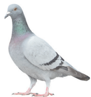
Van de Velde Uitvaart, Lievegem.